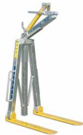
Volantino di bloccaggio